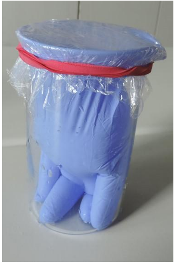
Abb.2: befüllter über ein Becherglas gestülpter Handschuh, abgedeckt