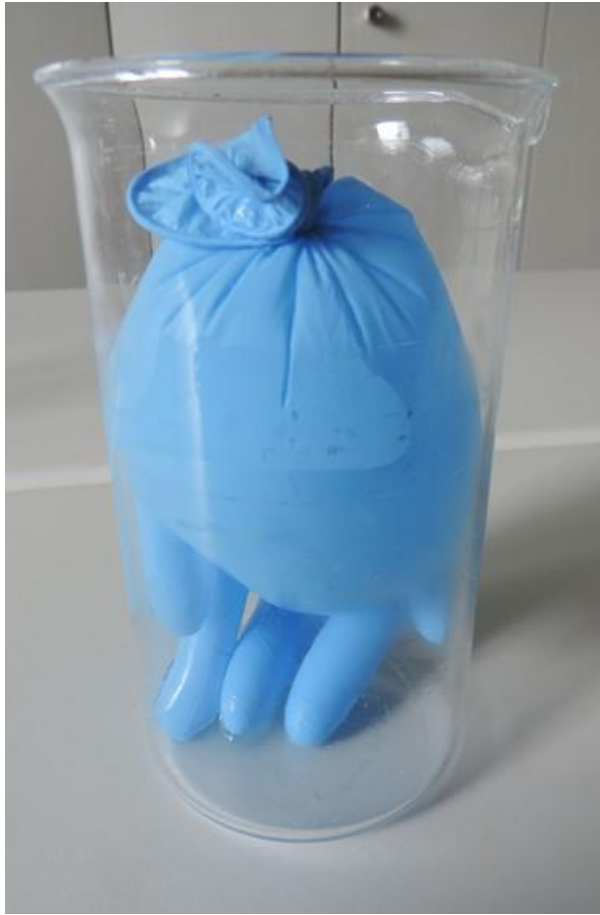
Abb. 1: befüllter verknoteter Handschuh